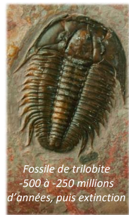
Fossile de trilobite -500 à -250 millions d'années, puis extinction