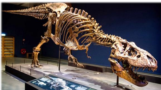
Trix, la Tyrannosaure Rex femelle dont on a retrouvé le squelette presque entier dans le Montana (USA). Elle est exposée au Muséum d'Histoire Naturelle de Paris. Elle a vécu il y a 68 millions d'années environ. Et est morte vers l'âge de 30 ans. Vu sa dentition, elle ne mangeait pas que des pâquerettes...